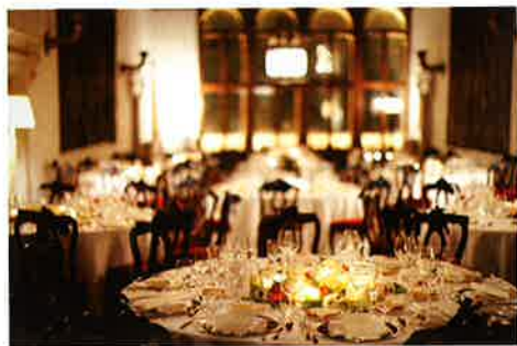
La tavola decorata con ortensie, ranuncoli e anemoni in bianco e verde.