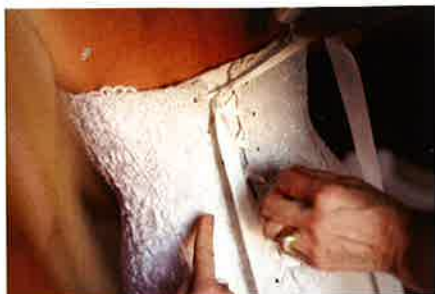
Le amiche aiutano Giorgia a stringere il bustier dell'abito in pizzo di seta.