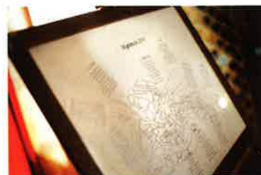
Una soluzione originale per il tableau mariage: usare i nomi delle fermate dei vaporetti.