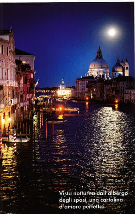
Vista notturna dall'albergo degli sposi, una cartolina d'amore perfetta.