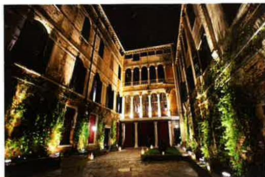
Il cortile interno dello splendido palazzo privato dove si è svolto il ricevimento, a lume di candela.