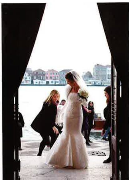
Gli ultimi ritocchi prima di percorrere la navata.